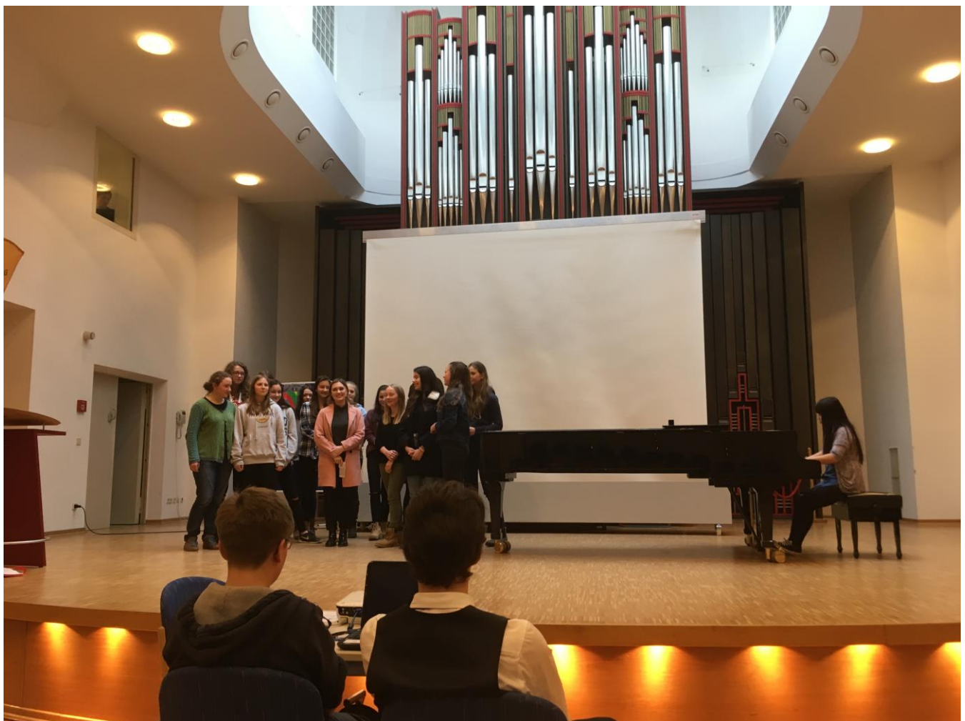
Musikalischer Beitrag der G 9A: Je veux (ZaZ)